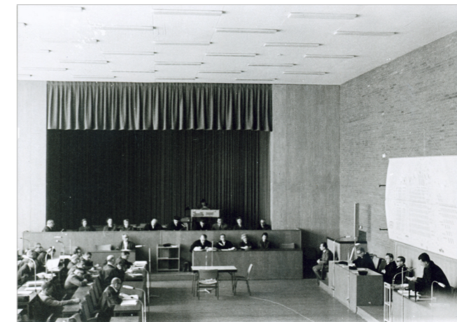
1. Frankfurter Auschwitz Prozess